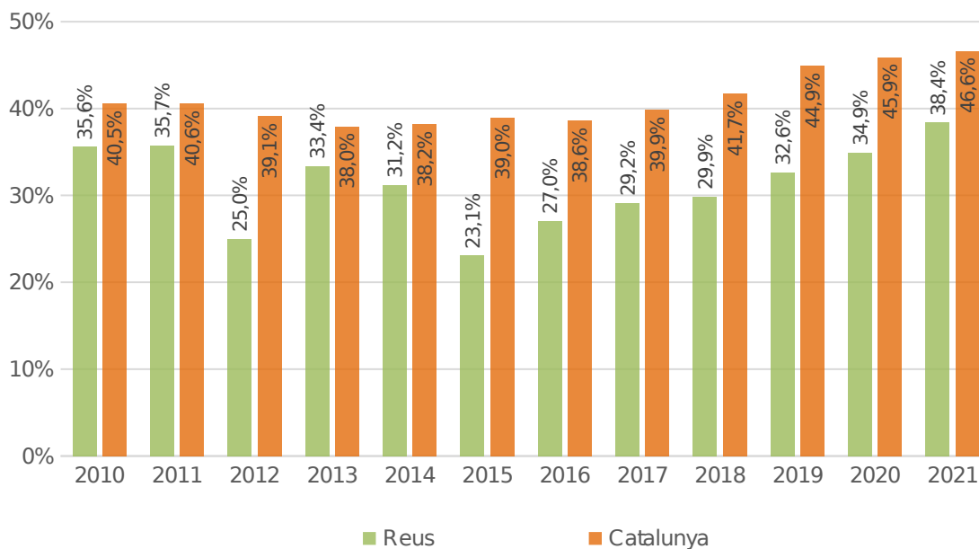
Figura 2. Evolució de la recollida selectiva bruta (%) a Reus i Catalunya (2010-2021).

Actualment, la recollida de residus municipals es realitza a través de diversos sistemes de recollida selectiva: (1) contenidors oberts ubicats al carrer i repartits en àrees d'aportació de recollida selectiva, (2) recollida en illes emergents d'ús exclusiu en l'àmbit domèstic al nucli antic, (3) recollida pneumàtica, (4) recollida porta a porta de residus comercials/industrials, (5) recollida porta a porta de mobles i altres voluminosos, o (6) recollida de poda en contenidors especials repartits en diversos punts de la ciutat, entre altres.